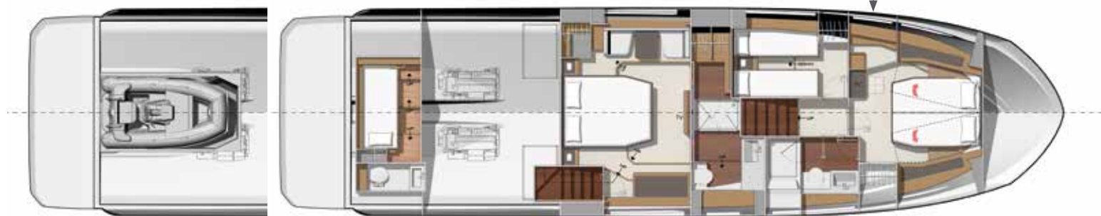
Model available with tender garage or skipper cabin