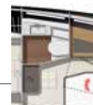
Model available with walk-in closet or bathroom