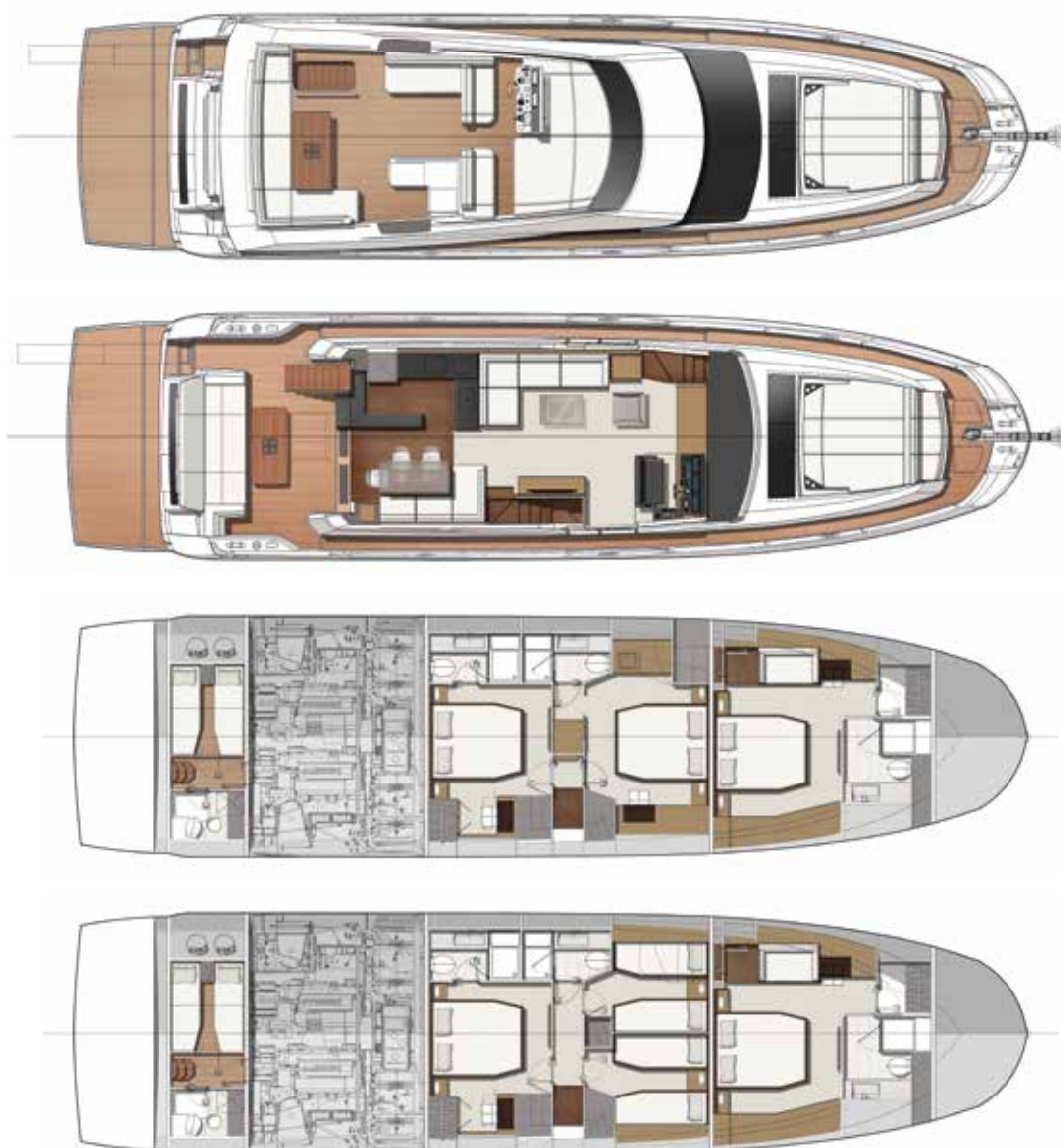
Model available with 3 or 4 staterooms